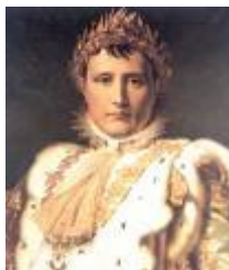
Louis le Pieux